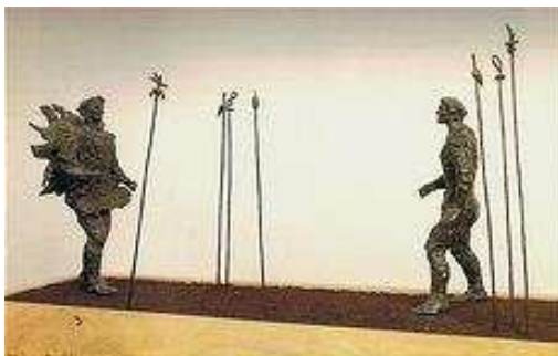
Gérard Garouste, Le Défi du soleil , Bronze, 1984

La Galerie des Modernes participe à diverses foires internationales comme la Biennale de Monaco, la Foire des Antiquaires de Belgique et à Paris, le Salon du Collectionneur et le Pavillon des Antiquaires .