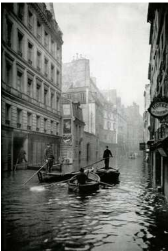
Rue de Seine.

L'histoire de Paris ne saurait ignorer celle de la Seine et de ses caprices. C'est Grégoire de Tours qui parle le premier d'une inondation à Paris, en février 583, qui porta un grave préjudice à la navigation. Mais chaque siècle, une dizaine de débordements surprennent les Parisiens.