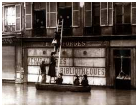
29, quai des Grands Augustins

Chaque crue de la Seine nous surprend. La DIREN (Direction de l'environnement) a notamment conçu plusieurs scénarii de crue, dans une perspective de prévention.