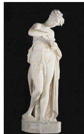
Psyché, Marbre de Carrare, Signée A. Carrier, XIX e siècle.

Désireux de partager sa passion avec les connaisseurs du monde entier, il présente pour sa deuxième participation au Salon du Collectionneur des sculptures en bronze ciselé et doré fondues par Barbedienne, des suites de tableaux allégoriques d'un style néoclassique, des vases japonisant en bronze patiné, ou encore un miroir en marqueterie d'ivoire et bois précieux. Des pièces rares qui séduiront les amoureux du XIX ème siècle.