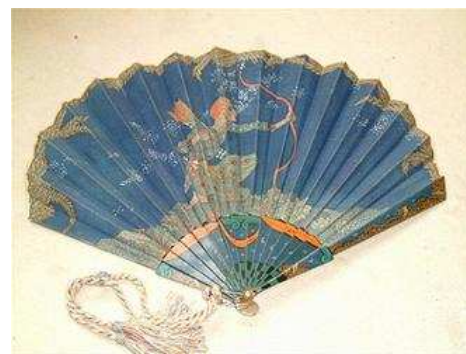
Eventail à la fontange créé en 1911 par Georges Barbier Pour la couturière Madame Jeanne Paquin

Spécialisée dans les éventails et les objets de curiosité , la Galerie Marie Maxime offre aux amateurs du Salon des Collectionneurs ses trésors cachés de coquetterie féminine, comme un flacon en or émaillé, ou un éventail art nouveau dans son écrin d'origine. Un rare garde d'épée d'apparat en ivoire, ou encore une miniature représentant de jeune femme cerclé d'or complètent cette sélection qui mise sur le raffinement de cette édition 2009.