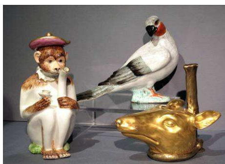
Les animaux en porcelaine, XVIII e siècle.