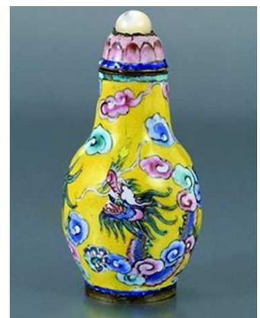
Tabatière en émail peint sur cuivre, Chine, 1730-1750.