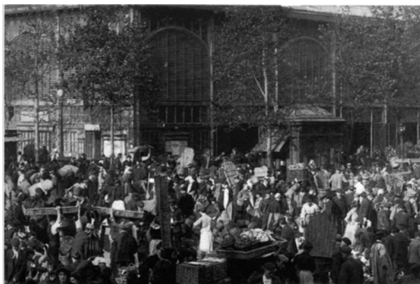
Les Halles à 6h du matin. Les primeurs. Carte postale.

Au XIX ème siècle, les Halles sont le centre névralgique de la capitale avec sa foule tourbillonnante et bigarrée, ses amoncellements de victuailles, ses flamboiements de couleurs, ses odeurs puissantes de fermes, de jardins et de marées.