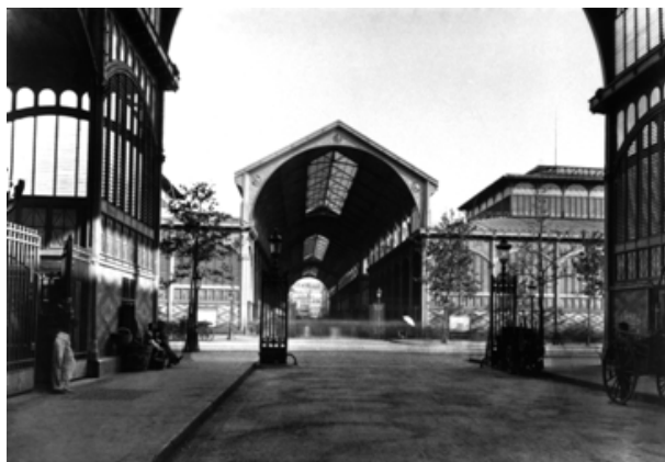
Vue des Halles, Ch. Marville, Coll. Part.